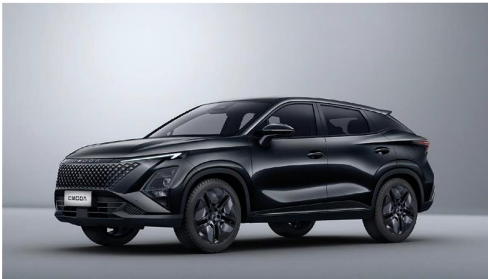
CARBON BLACK (CL) – metāliska krāsa Bez papildmaksas