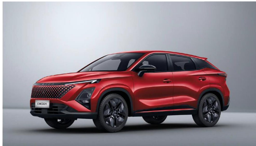
BLOOD RED (NL) – metāliska krāsa Bez papildmaksas