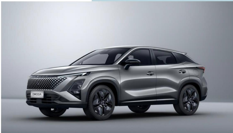
PHANTOM GRAY (GV) – metāliska krāsa Bez papildmaksas