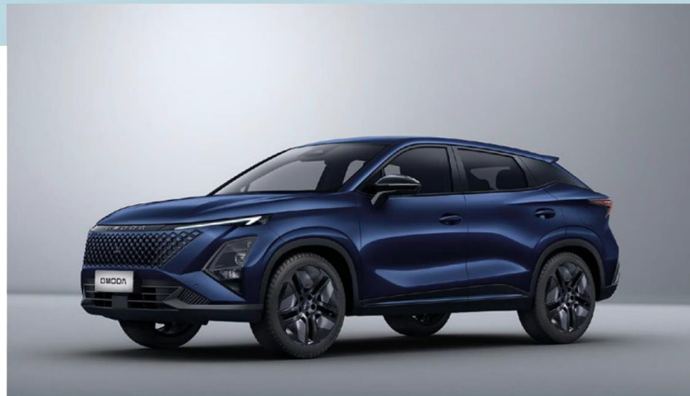
MIDNIGHT BLUE (WB) – metāliska krāsa Bez papildmaksas