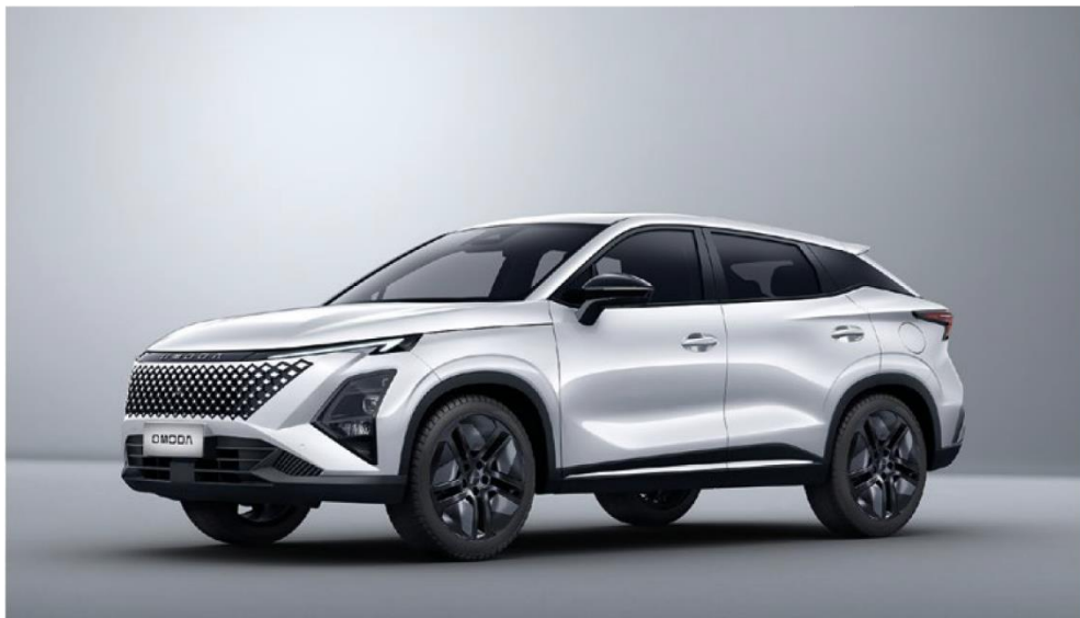
KHAKI WHITE (BW) – metāliska krāsa Bez papildmaksas