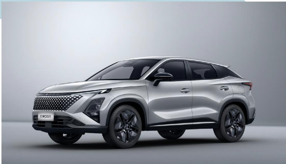
AVIATION SILVER (KX) – metāliska krāsa Bez papildmaksas