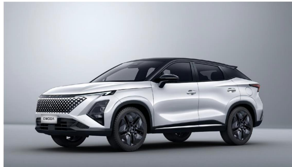
KHAKI WHITE AR MELNU JUMTU (ZE) Piemaksa 500EUR (tikai Premium versijā)